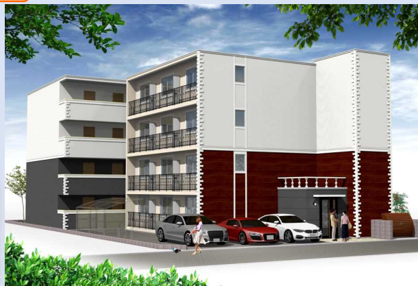
完成イメージパース