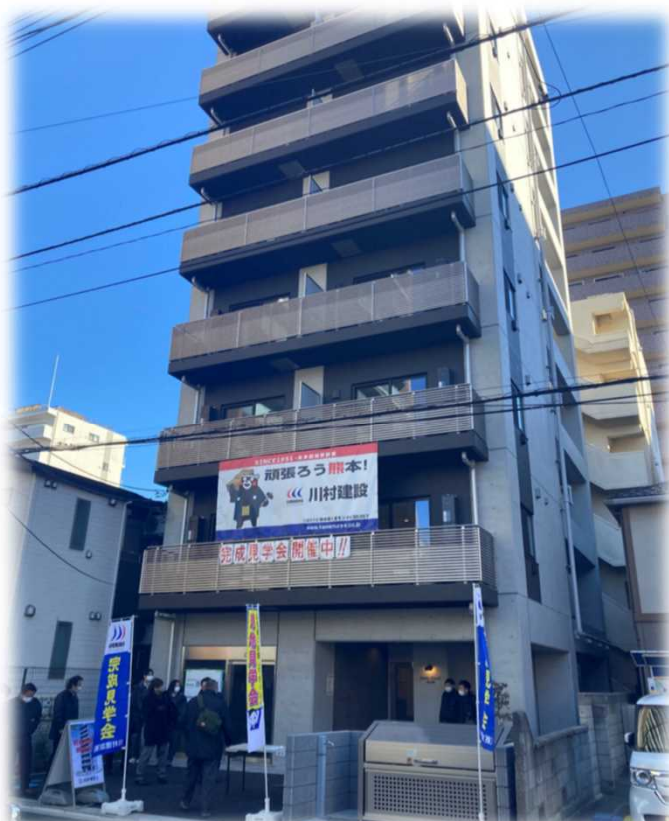
↑ 個強固なRC造ラーメン構造

この度、2日にわたり、RC造賃貸マンション『ステラコート北浦和』の完成見学会を開催致しました。当日は、多くの方々にご来場頂き、大変盛況となりました。誠にありがとうございました。ございました。