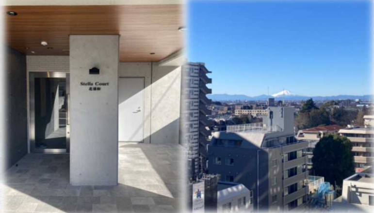
↑ 最上階からの絶景！