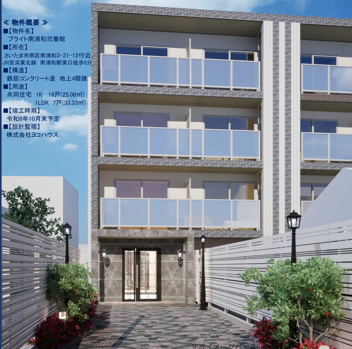
完成イメージパース

J R 南 浦 和 駅 東 口 徒 歩 5 分 10 月 末 完 成 予 定 ！