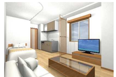
内観イメージパース

*この良さは、図面だけでは伝わりません！ぜひ、ご来場頂き直に感じてみて下さい！！ 今回はモデルルームのご案内ですが、6月には全タイプを体感出来る完成見学会を開催予定です。