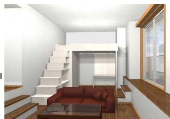
内観イメージパース