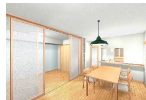
内観イメージパース

※キッチンL1, 800対面なので広々と使えます。 ※洋室とリビングの引戸を開けば、大空間として広々と使えます。