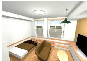
内観イメージパース