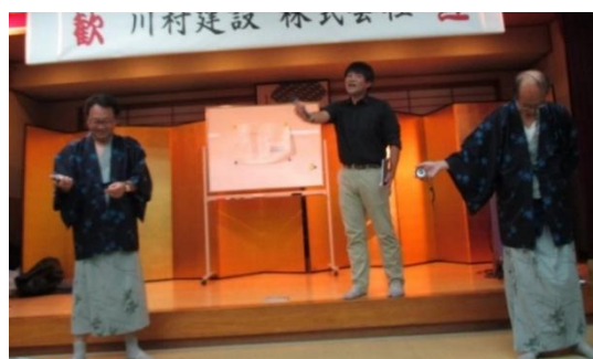
〈10秒ぴったり当て対決〉