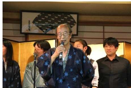
〈各部門紹介(工事部)〉

弊社ではホテル経営も行っており日頃離れて働く社員同士のコミュニケーションを深める為、毎年1泊2日で社員旅行が行われています。