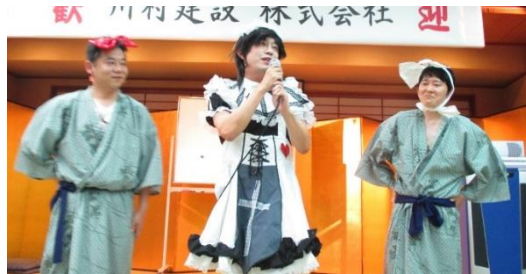
<準備風景と変身後 お供を連れて参上です>