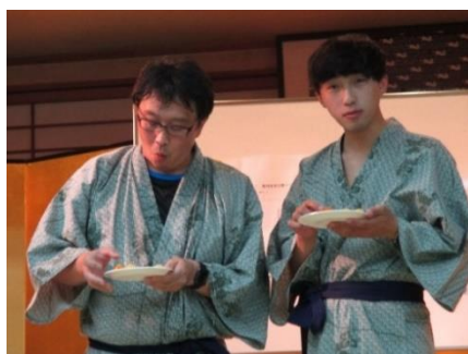
〈大人気スナック味当て対決〉