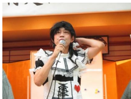
<多数決の結果優勝はこの方でした！！>