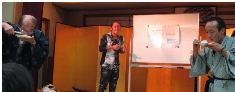
〈アイス早食い対決〉