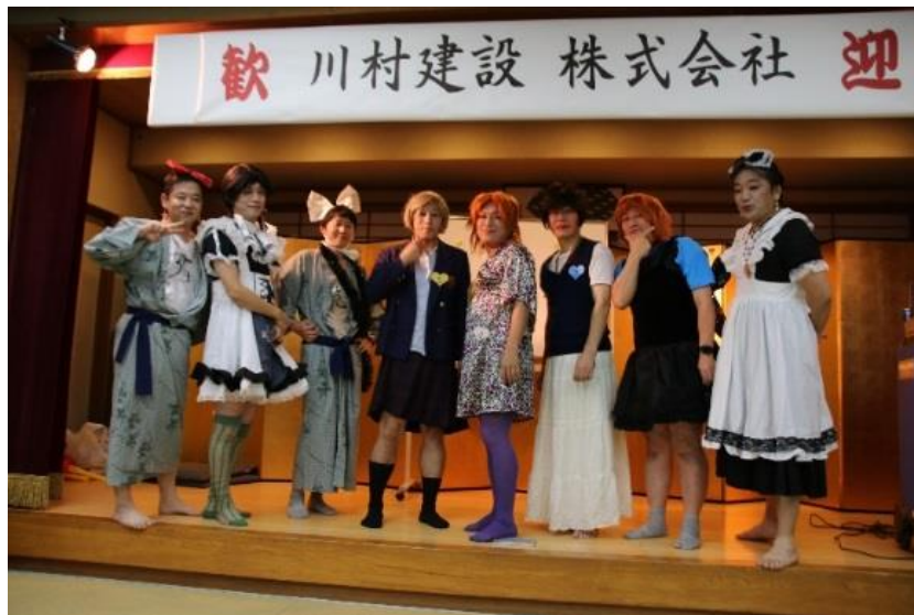
<みなさんと並ぶと圧巻です>