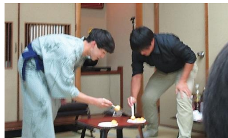
〈ピンポン玉早運び対決〉