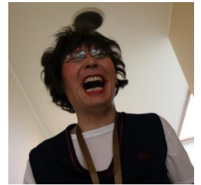
<みなさんの変身後の姿意外とノリノリの方もいました！>