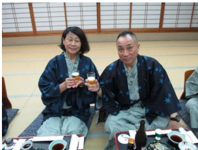
〈仲の良い社長夫婦〉