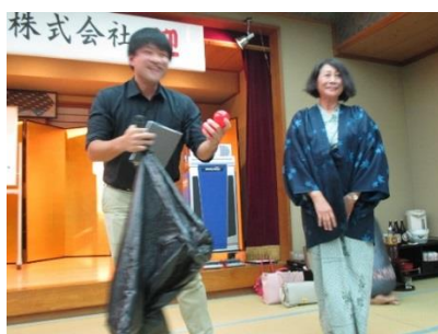
<抽選で参加者を決めます>

工事部、企画設計部はランダムで選ばれた 8 名が対決を行いました。 逆トーナメント制で最後に残った敗者が罰ゲームとの事でしたので みなさん必死に勝負に挑んでいます。