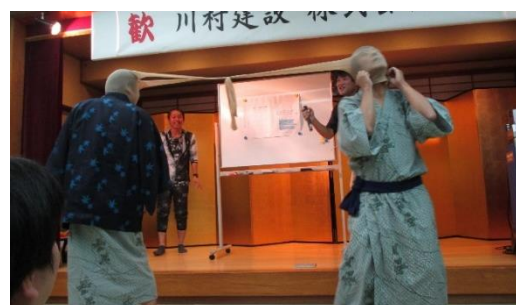
<ストッキング相撲>